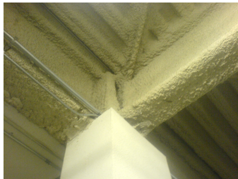
Flocage de protection contre les incendies - dans ce cas, sans amiante (date plus récente)