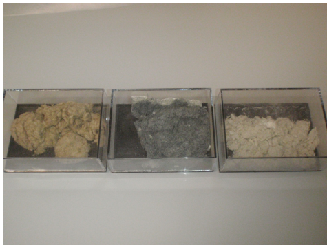
Différents types d'amiante floqué: de gauche à droite: amosite (amiante brun), crocidolite (amiante bleu) et chrysotyle (amiante blanc)