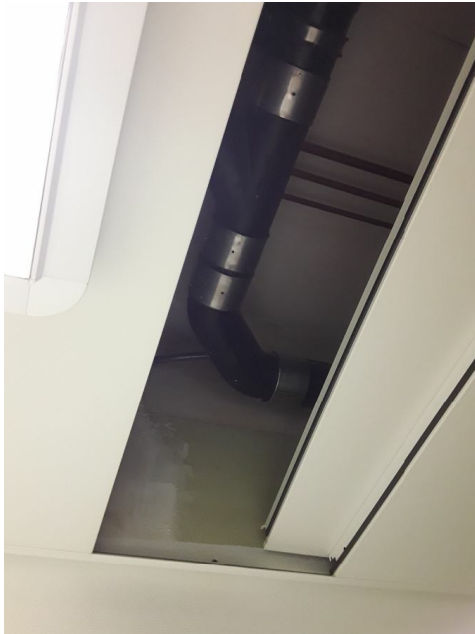
Peinture, HSE Conseils