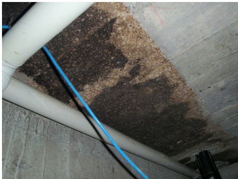
Isolation en liège bitume (pont thermique). L'isolation a été placée dans le coffrage avant la pose du béton.