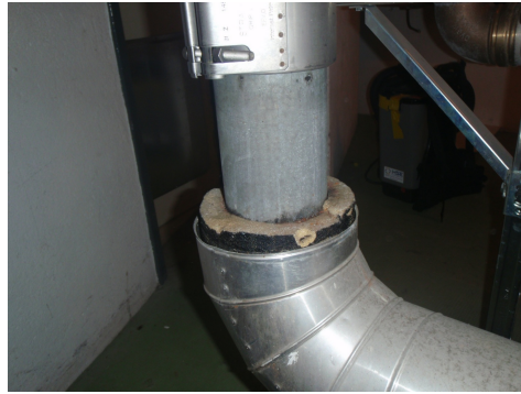
Calorifugeage de conduite avec une peinture bitumineuse contenant de l'amiante. Il s'agit souvent de la conduite d'eau froide (pour empêcher la condensation).