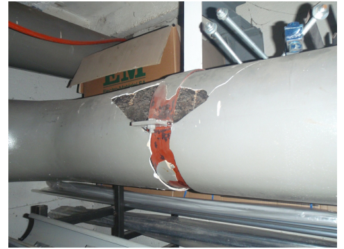
Calorifugeage en liège bitume contenant de l'amiante dans un enduit plâtre. Amiante dans le plâtre.