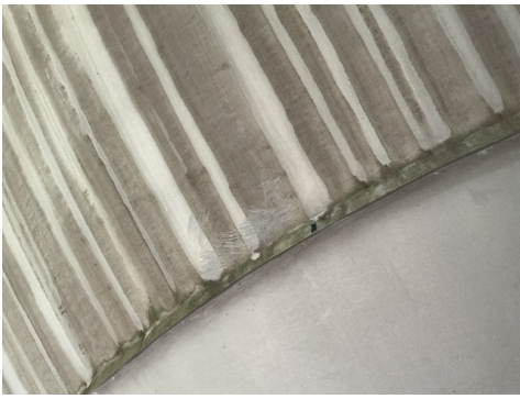
Vernice su un serbatoio di stoccaggio di gas ad alta pressione, TFB Technik und Forschung im Betonbau