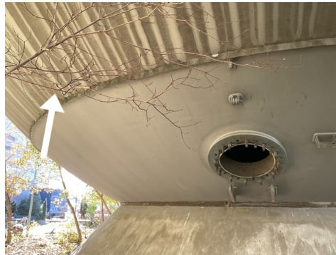
Vernice su un serbatoio di stoccaggio di gas ad alta pressione, TFB Technik und Forschung im Betonbau