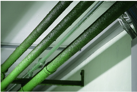
Lacca contenente amianto su tubature, Suva