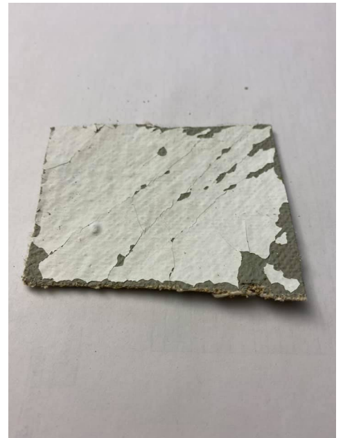
Rivestimento murale Stramin con amianto nella vernice e nella colla, Solgeo