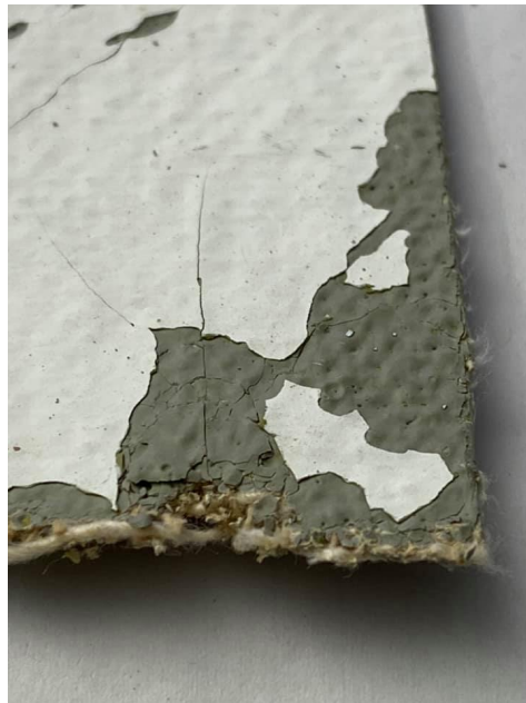
Rivestimento murale Stramin con amianto nella vernice e nella colla, Solgeo