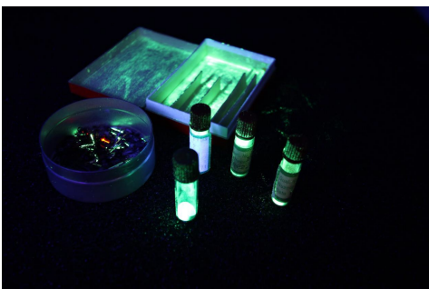
Radioaktive Farbe für Zifferblätter und Zeiger sowie Radium-Zeiger.