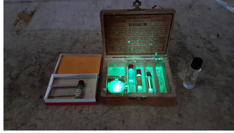
Altes Radium-Set.