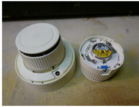
Ionisationsrauchmelder der Marke Cerberus mit Americium.