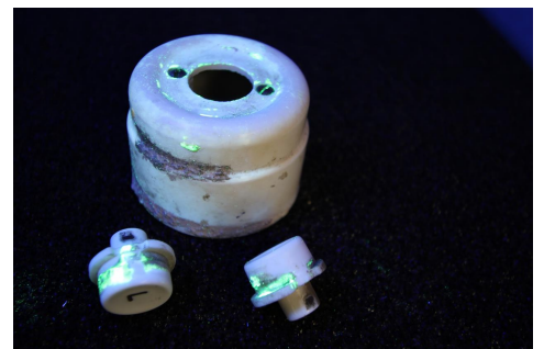
Lichtschalter mit Radium-haltiger Leuchtfarbe.