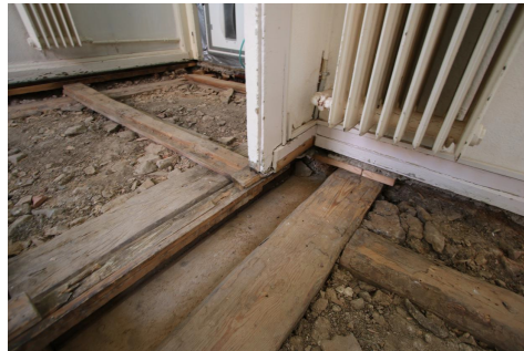
freigelegte Radium-kontaminierte Schlacke eines Zwischenbodens.