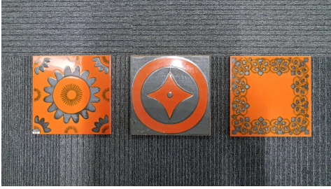
Fliesen mit radioaktiver Glasur.