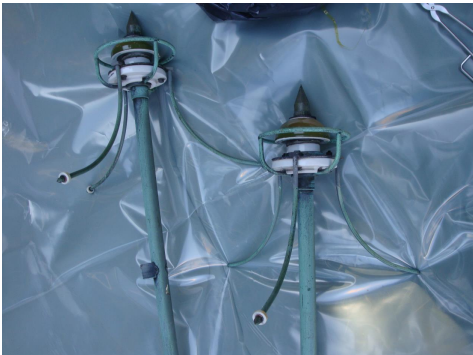
demontierte Radium-Blitzableiter.