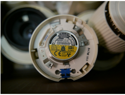
Ionisationsrauchmelder der Marke Cerberus mit Americium.