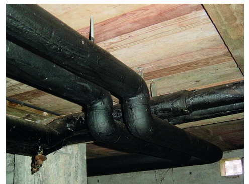
Rivestimento bituminoso sull'isolamento di tubazioni, Suva