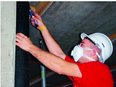
Rimozione dell'isolamento di tubazioni con rivestimento bituminoso contenente amianto, Suva