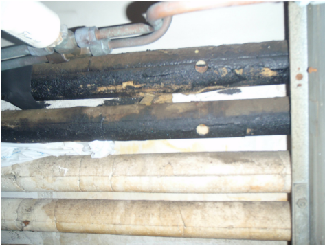
Isolamento di tubazioni rivestito con una vernice bituminosa contenente amianto